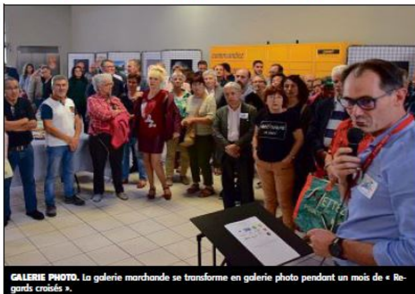
GALERIE PHOTO. La galerie marchande se transforme en galerie photo pendant un mois de « Regards croisés ».

Ces portraits d'abord réalisés au domicile des seniors pour plus de naturel ont ensuite été faits dans un local prêté par Auchan dans lequel un studio de prise de vue a été installé. En effet chez les habitants il fallait parfois pousser les meubles pour mettre en place tout le matériel et avoir assez